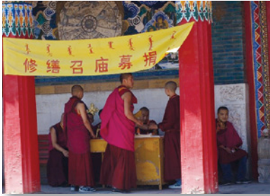
Jonge monniken in een klooster in Hohot (Binnen-Mongolië) bezig met fondsenwerving voor verder herstel van het klooster

Geschat wordt dat een kwart van de Chinese bevolking, ondanks jaren van religieuze verdrukking, nog steeds beïnvloed wordt door religie. Dat zijn in volgorde van grootte het taoïsme, het boeddhisme, het christendom en de islam. Al in de 6e eeuw kwam het boeddhisme vanuit India naar China, waar het snel wortel schoot. Net als in Japan ontwikkelde zich in China een eigen variant van het boeddhisme. Daarom beschouwt president Xi Jinping het Chinese boeddhisme als een autochtone religie, waar hij geen moeite mee heeft.