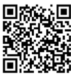
2 e collecte deze zondag t/m zaterdag

Terwijl de tafel wordt klaargemaakt, zingen we Wij willen de bruiloftsgasten zijn Lied 525, 1, 2 en 4